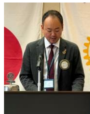
安原次期社会奉仕委員長