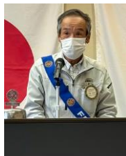
小原次期国際奉仕委員長代理