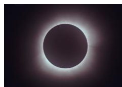
最大食と太陽コロナ

【薬師寺会員】仕事とロータリーを休んで、皆既日食を見にアメリカへ行ってきました。※貴重な皆既日食の写真をご提供頂きました。