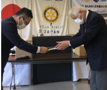
(左)岡田会長 (右)佐野会員