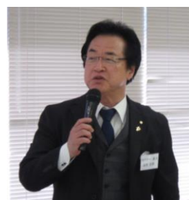
ガバナー補佐 金谷晋爾様