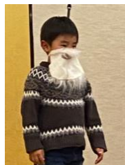
小さなサンタさん?