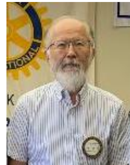
源会員 遺伝子・体内時計について