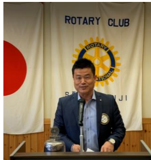
塚本会員 総社市 土地の相場について