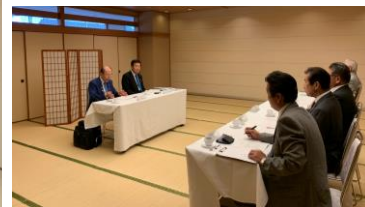
ガバナーとの懇談会